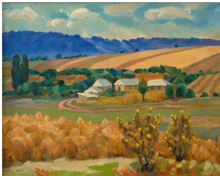
Eleonora Romanescu. Peisaj la Secăreni I , u.p. 70 × 100 cm, 1975

Desigur, o atare perspectivă depinde exclusiv de opțiunile și disponibilitatea autorului, dar importanța și semnificațiile unui atare posibil demers rămân incontestabile.